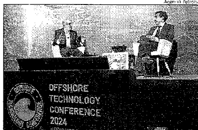
PETROBRAS anuncia que colocará 14 plataformas em produção, duas em SE

Para atender a essa demanda, os fornecedores terão