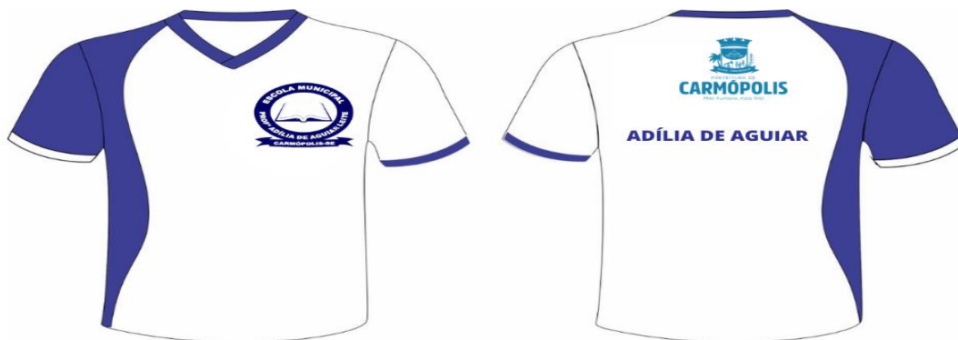
Figura 01 – Desenho ilustrativo do Uniforme do Ensino Fundamental (Anos iniciais e finais)