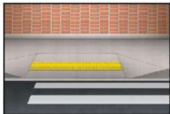
Rebaixamento com abas laterais