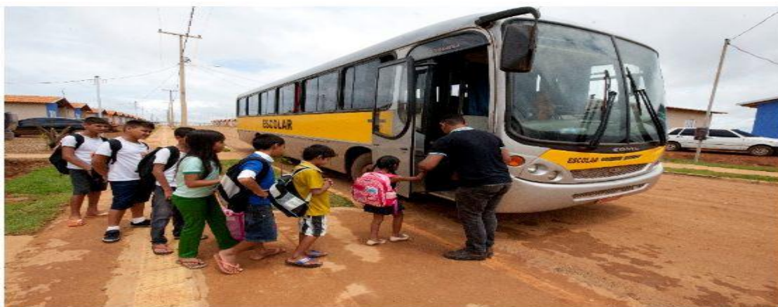
Acesso à Educação

No aspecto ambiental, a manutenção das estradas de terra esta ligada diretamente ao controle de erosão e perda de solo, a conservação e recuperação das áreas marginais às estradas, a diminuição do assoreamento de córregos e rios. Fatores estes que afetam a composição da paisagem local e a preservação do meio ambiente.