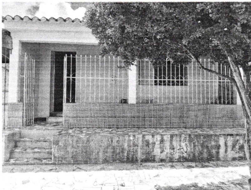
Imagem 2 – Fachada