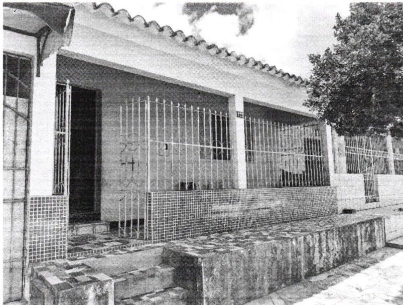
Imagem 1 – Fachada