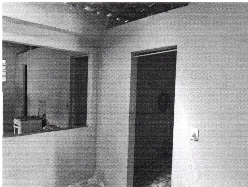
Imagem 4 – Quarto