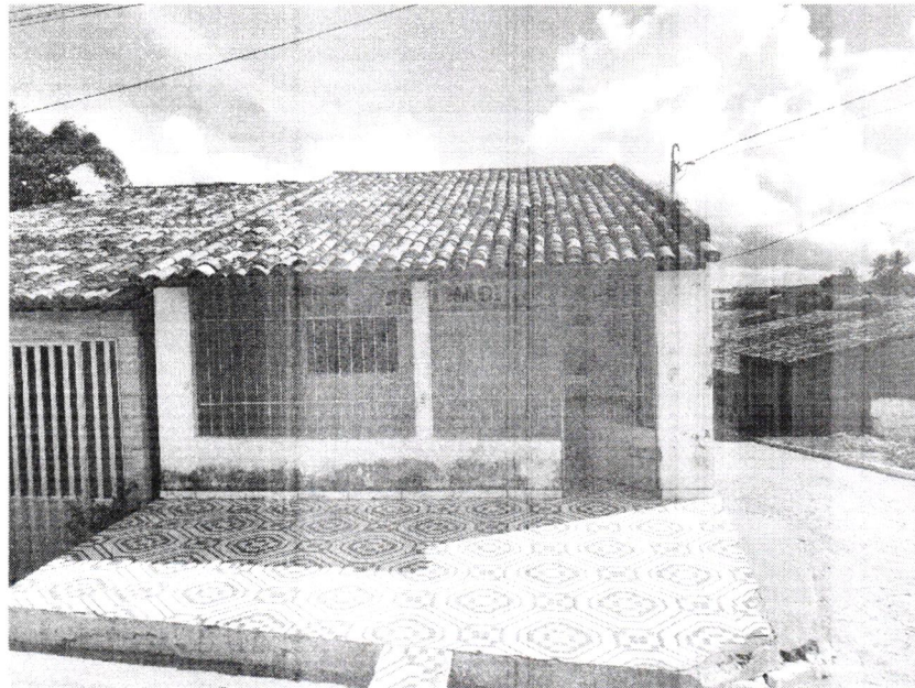
Imagem 1 – Fachada