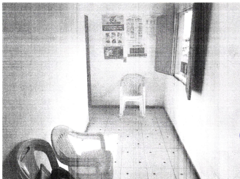
Imagem 2 – Corredor Interno

Handwritten signature or mark in blue ink.