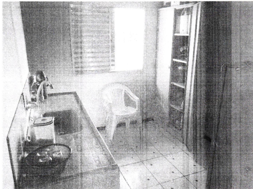
Imagem 4 – Copa

Handwritten signature or mark in blue ink.