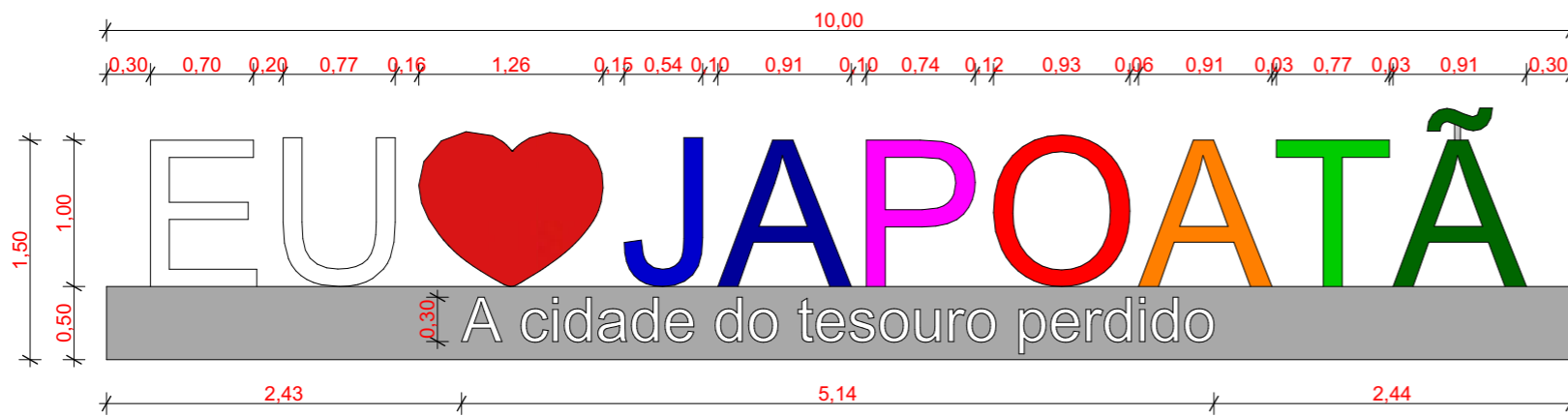
06 LETREIRO - VISTA FRONTAL Escala: 1:50