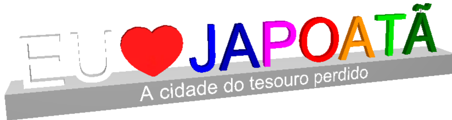
08 PERSPECTIVA - LETREIRO Escala: 1:200