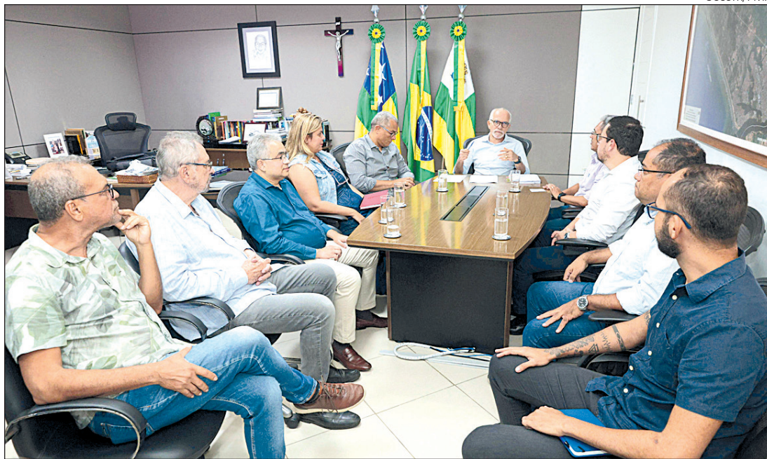
PREFEITO Edvaldo Nogueira anuncia um reajuste de 4% para os servidores de Aracaju

De acordo com o secretário municipal da Fazenda, Jeferson