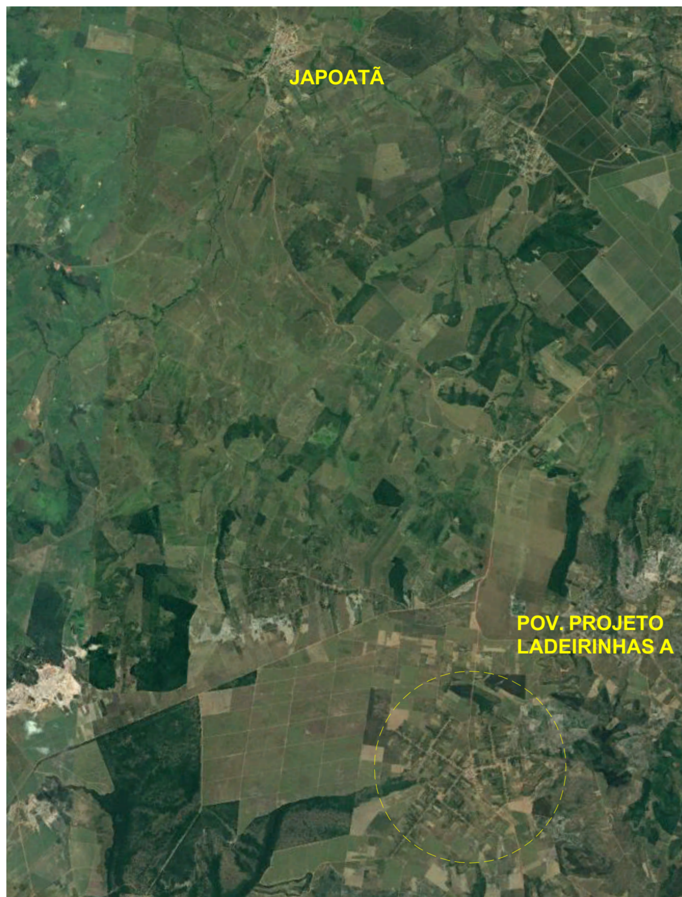
01 PLANTA - SITUAÇÃO