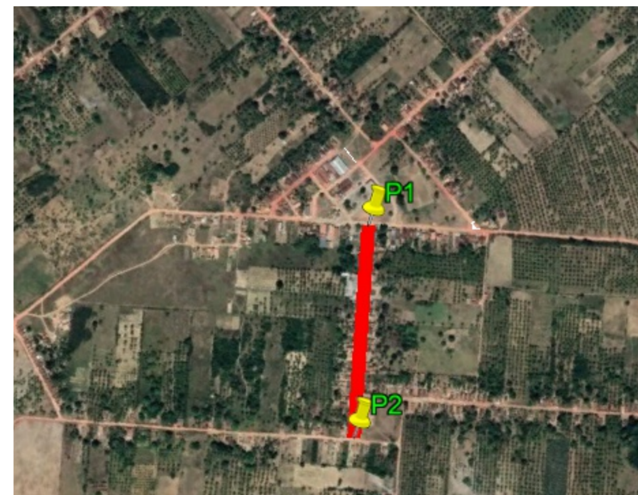
02 PLANTA - LOCALIZAÇÃO