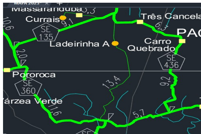
IMAGEM 1: Trecho que liga as Rodovias SE-360 E SE-436 (NÃO PAVIMENTADAS)

A área a ser pavimentada no Povoado Projeto Ladeirasnhas “A”, zona rural do município de Japoatã, fica cerca de 24 km da Sede Municipal e conecta transversalmente à rodovia municipal que interliga as rodovias estaduais SE-360 E SE-436, conforme imagem abaixo, extraídas do mapa rodoviário 2023 elaborado pelo DER/SE ( https://der.se.gov.br/mapa-rodoviario/ ).