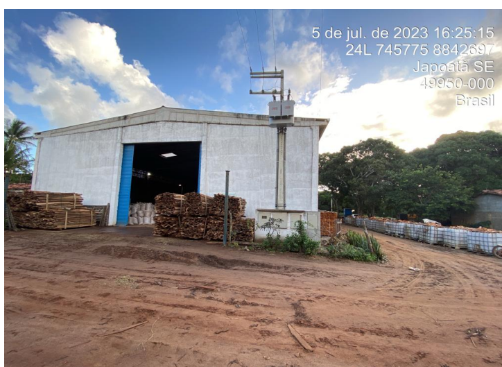
FOTOGRAFIA 1: Instalações da NSA AGRONEGÓCIO LTDA (Industria de Processamento de Madeira)

Para melhor especificar os locais e o tipo de produção, segue fotografias georreferenciadas dos locais indicados na imagem 3.