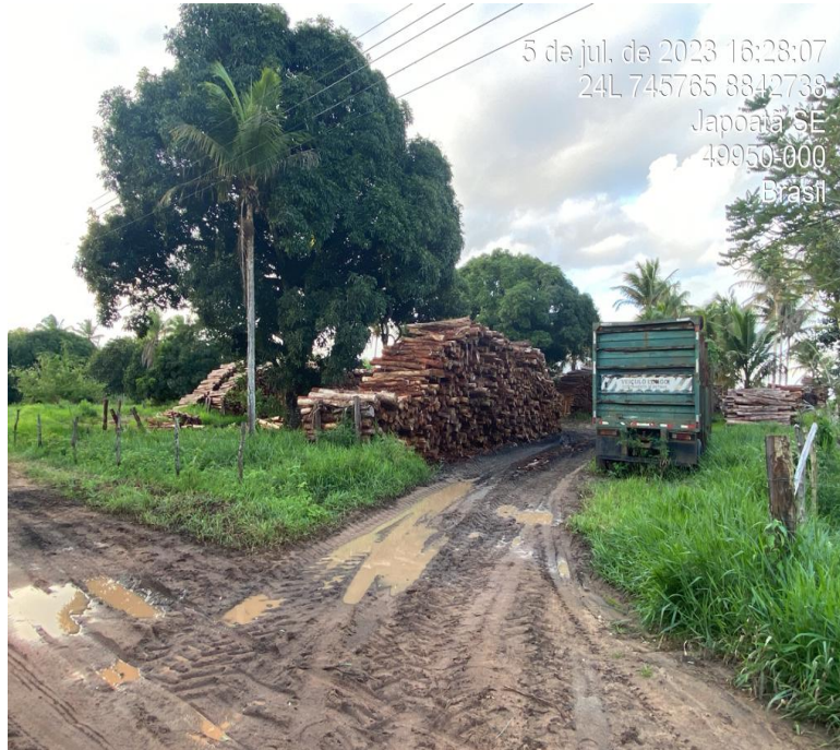
FOTOGRAFIA 2: Insumos da Industria NSA agro negócio