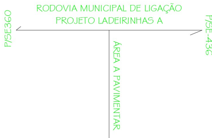
IMAGEM 2: Esquema indicando a situação da via em relação a malha rodoviária

A função da via a ser pavimentada é escoar os produtos produzidos no interior do Povoado Projeto Ladeirasnhas A, destacando-se os derivados de eucalipto, produzidos pela Indústria de processamento de madeira N.S.A agronegócio LTDA, e o côco seco produzido por pequenos agricultores.