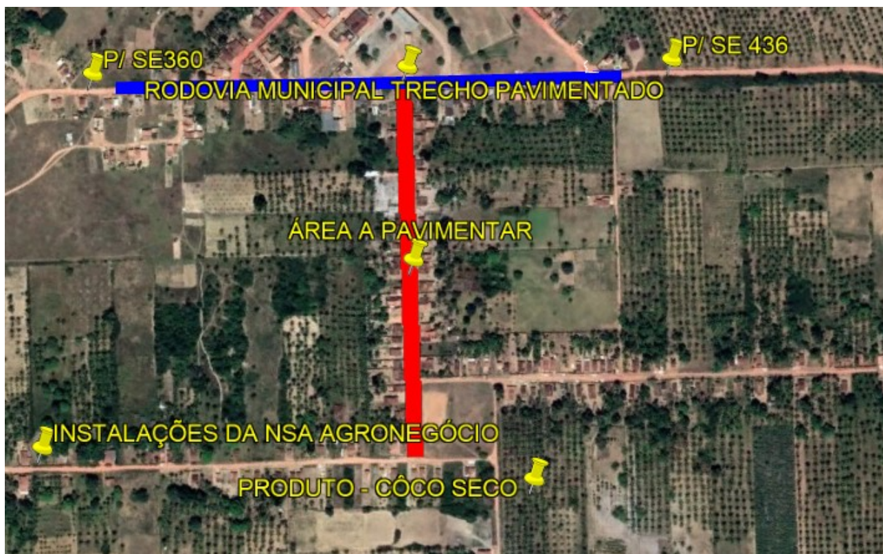
IMAGEM 3: Disposição de produção do Pov. Projeto Ladeirashas “A”

Abaixo segue imagem que mostra a área produtiva entorno da área a pavimentar: