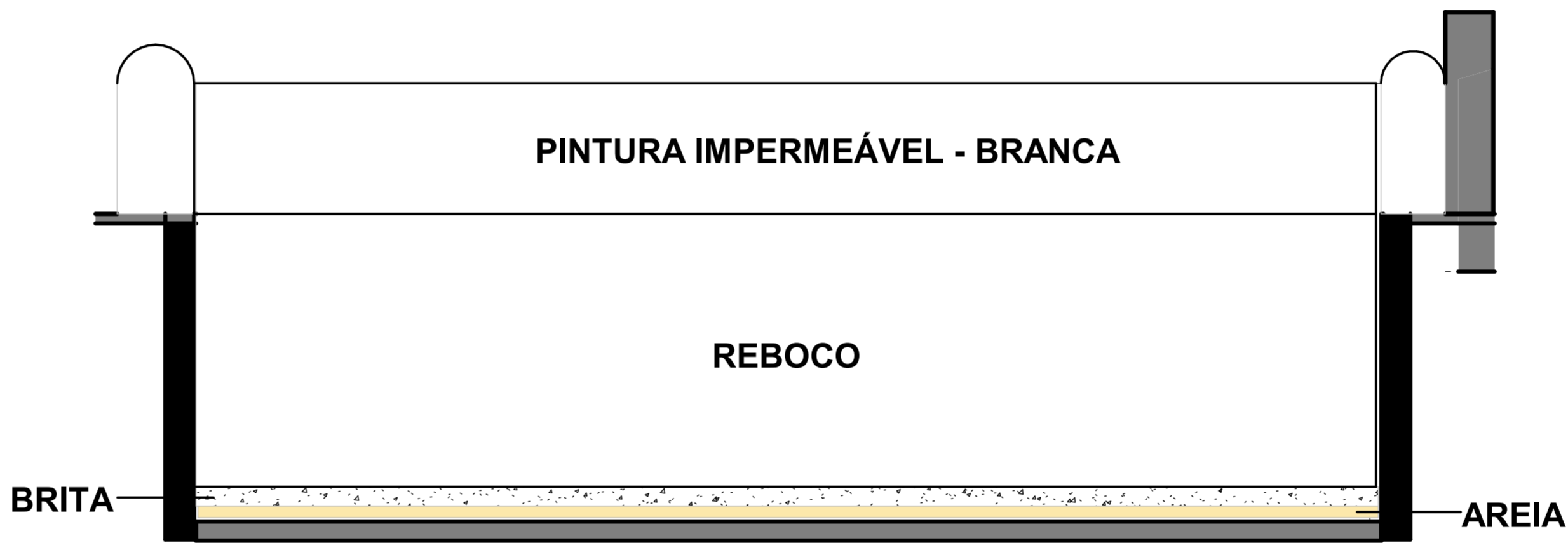
Detalhamento Piscina ESCALA 1:25

Thayna Rocha Souza Engenheira Civil CREA/ SE 2719189758