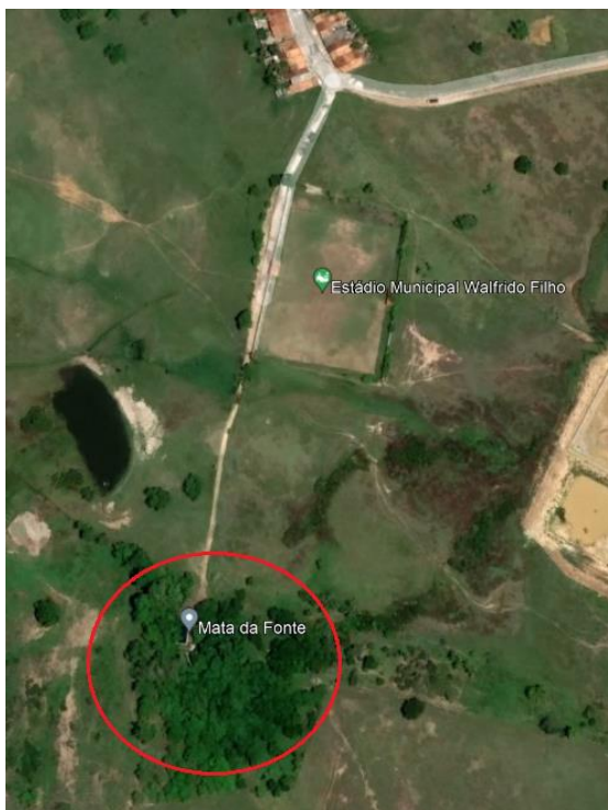
Imagem 2: Localização do Terreno.

Thayna Reda Souza Engenheira Civil CREA/SE 2719189758