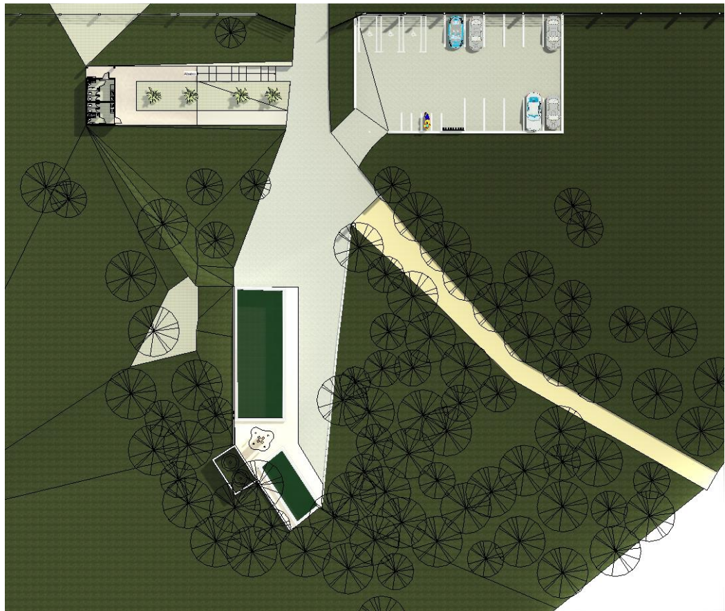
Imagem 3: Planta de Implantação da Obra.

Trata-se de uma restauração nas fontes e extremidades, onde foi pensado de preservar as formas e curvas naturais do terreno, assim preservar o máximo as suas vegetações e o desenho natural do local, com a intenção de valorizar e organizar o local visado um cercamento com pilastras brancas e meio fio e por fim criará espaços de integração entre as fontes como mostra a imagem abaixo: