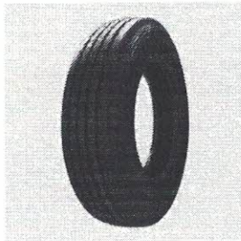
MGM 215/75R17.5 MGMI7 PR16 135/133J D