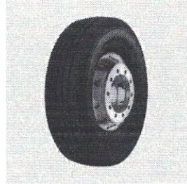
PIR 10.00R20 FORMULA DRIVER II 146/143L TT