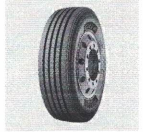
GIT 275/80R22.5 GSR225 PR16 149/146L D