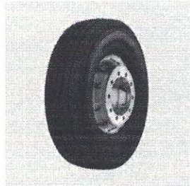
PIR 9.00-20 FORMULA DRIVER II PR16 140/137L D TT