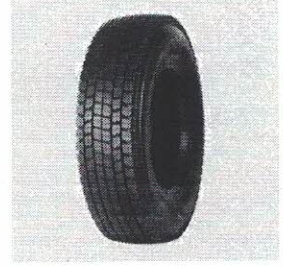
DRC 275/80R22.5 D721 PR16 B T