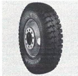
CTL 10.00-20 CL650 PR16 B 146/142K