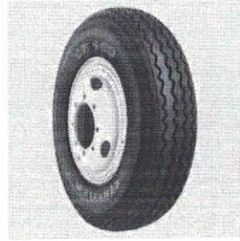
CTL 750-16 CR100 PR14 122/118M D TT (B)