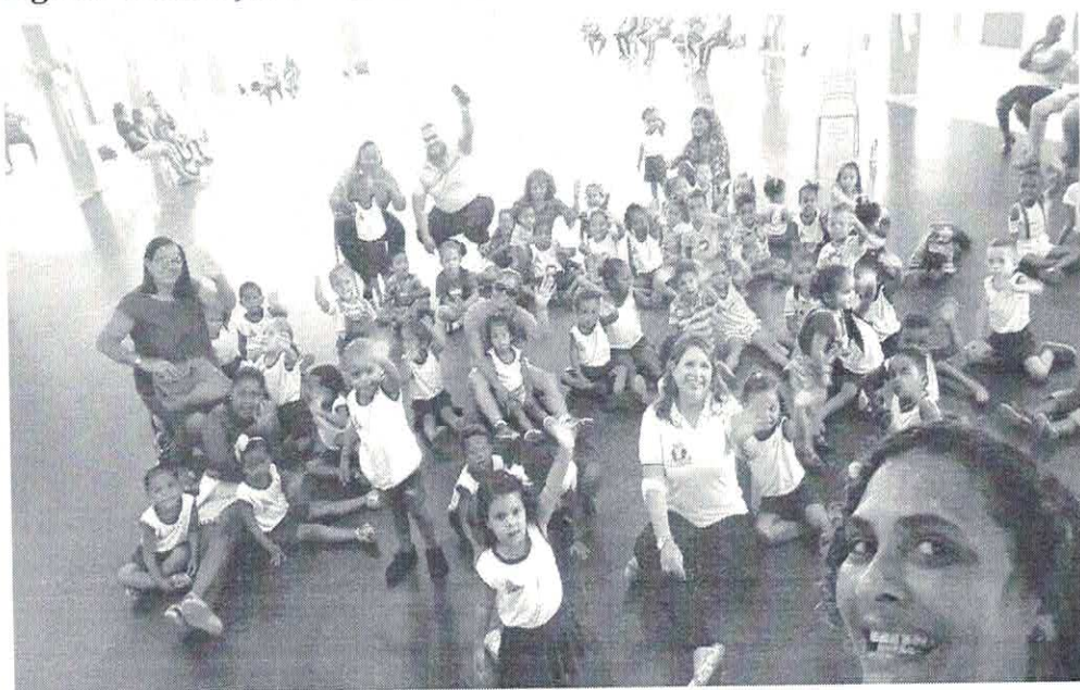
Figura 3: Contação de história nas Creches da Rede