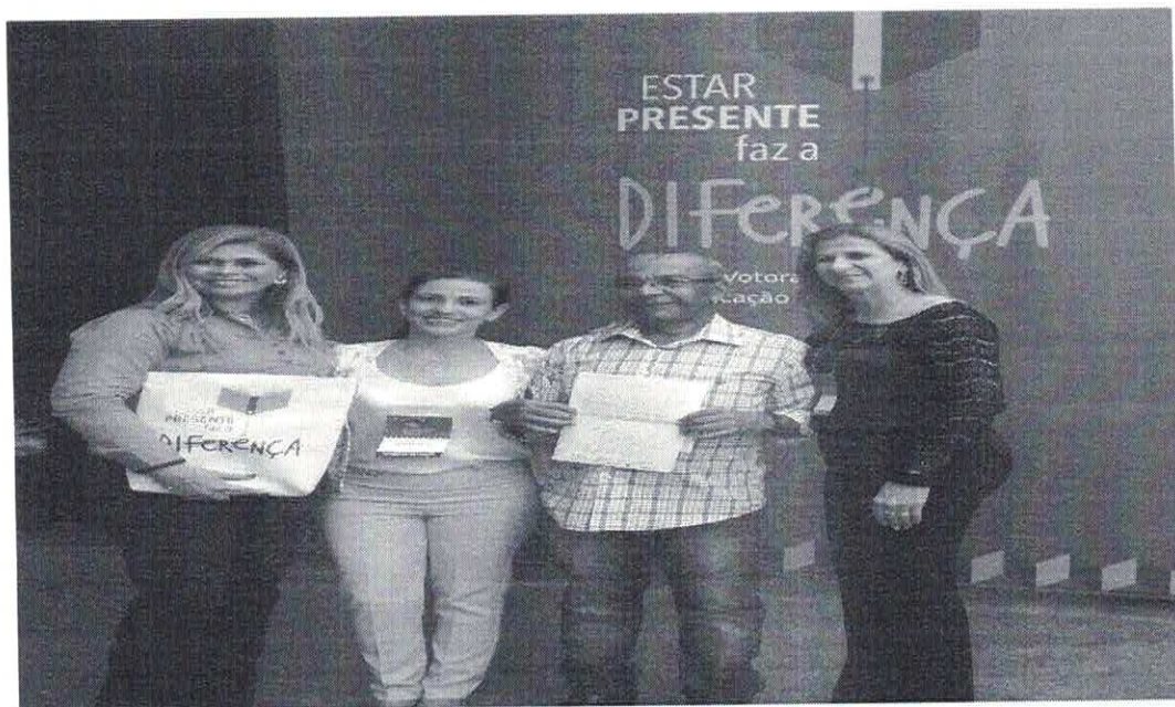
Figura 3: Laranjeiras é contemplada com o Programa Votorantim pela Educação