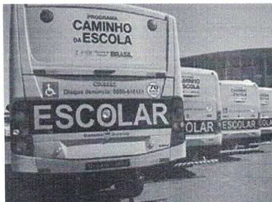
Figura 1: Aumento no quantitativo da frota