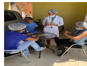
Atividade lúdica com paciente para resgate da memória cultural