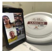
Café da manhã com cuidadores on-line.