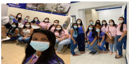
Equipe SAD Tobias Barreto/SE, recebe equipe SAD de São Sebastião do Passe/BA para trocar experiências