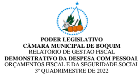
Tabela 1 - Demonstrativo da Despesa com Pessoal - Estados, DF e Municípios RCF - ANEXO 1 (LRF, art. 55, inciso I, alínea "a")