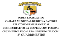
Tabela 1 - Demonstrativo da Despesa com Pessoal - Estados, DF, Municípios RGF - ANEXO 1 (LRF, art. 55, inciso I, alínea "a")