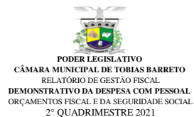
Tabela 1 - Demonstrativo da Despesa com Pessoal - Estados, DF, Municípios RGF - ANEXO 1 (LRF, art. 55, inciso I, alínea "a")