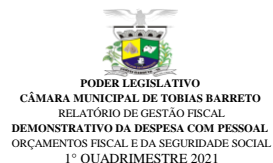
Tabela 1 - Demonstrativo da Despesa com Pessoal - Estados, DF, Municípios RGF - ANEXO 1 (LRF, art. 55, inciso I, alínea "a")