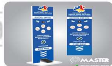
02 totens com dispensador de álcool gel e pedal