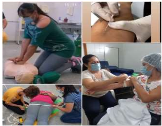
Treinamento dos profissionais