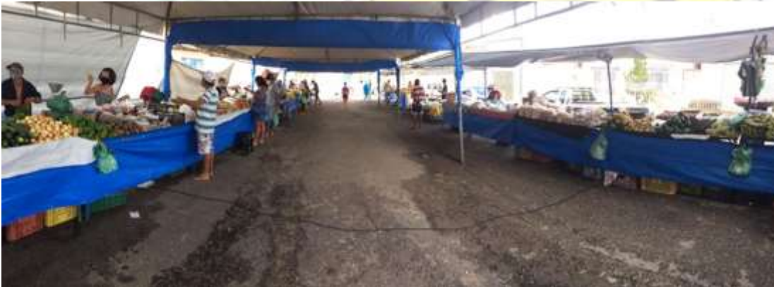
Estruturação da feira livre para o enfrentamento ao coronavírus