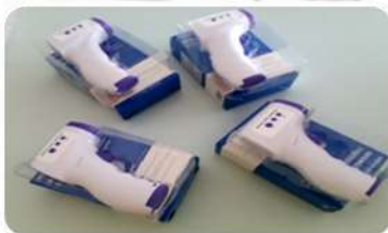
04 termômetros infra vermelho