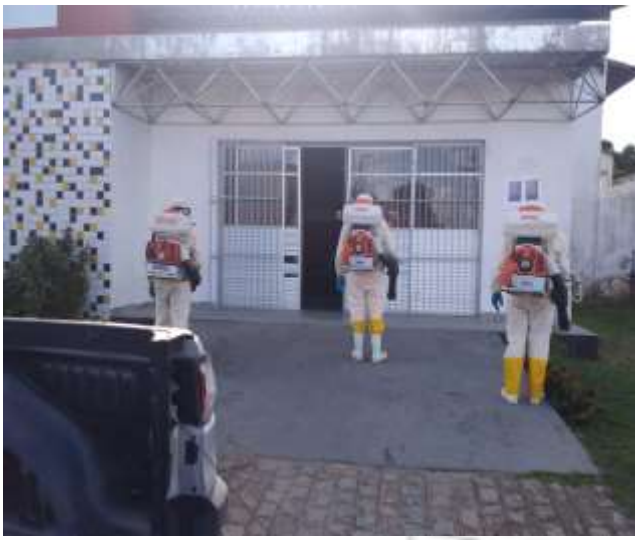
Higienização de prédios públicos