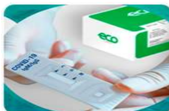
310 testes rápidos IGG e IGM