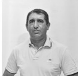
Juliano Aparecido da Silva (Toquinho)