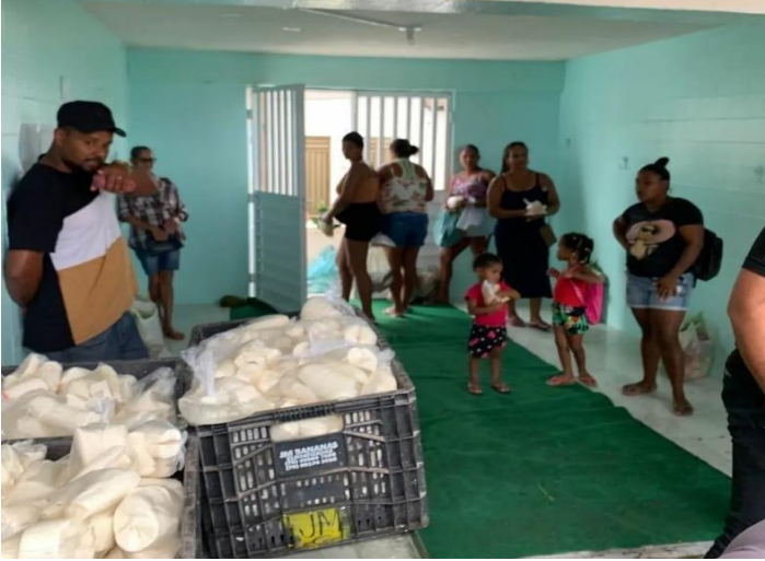
POSTO AVANÇADO DE IDENTIFICAÇÃO MARIA JULIETA DE JESUS