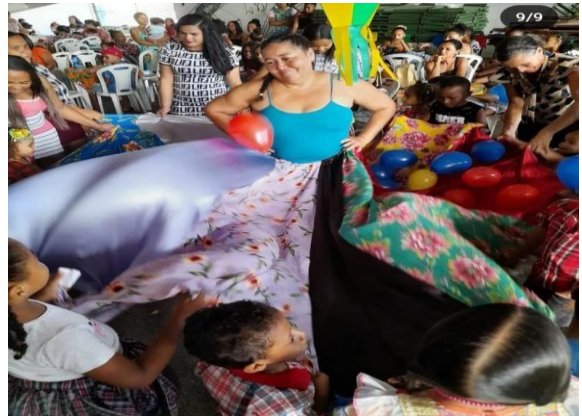
Batalhão Reviver do SCFV para Idosos