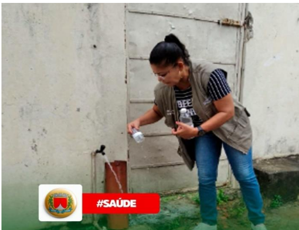
Coleta de Água