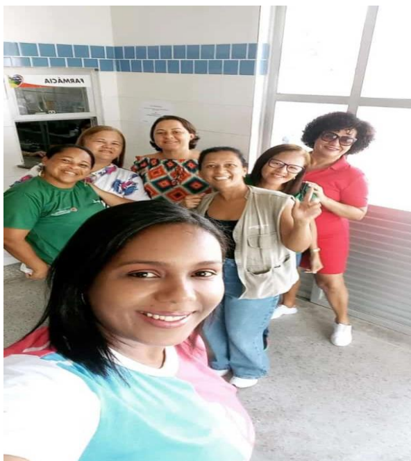
Reunião de Equipe