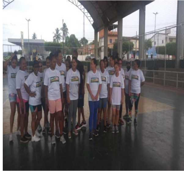
Academia da Saúde