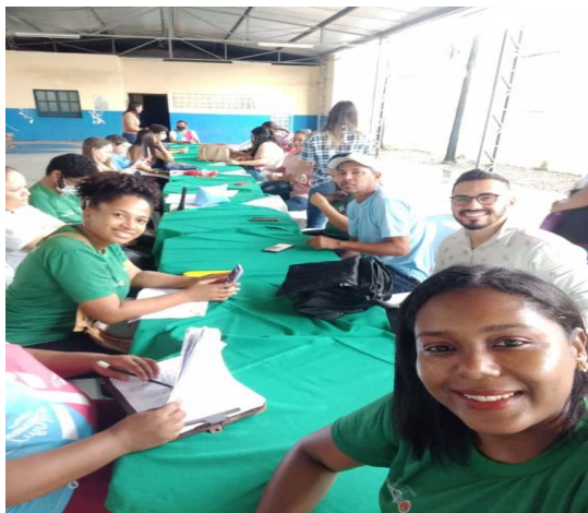
Reunião com as ESF