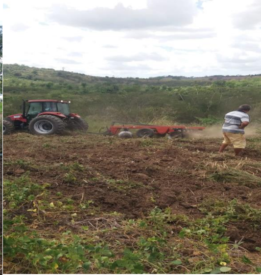
Agricultura e Centro de Referência e Assistência Social - AgroCras