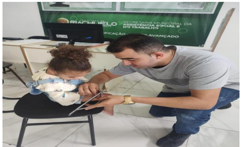
Capacitação dos profissionais – Prontuário Eletrônico