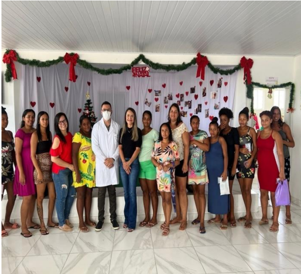
Palestra com Gestantes