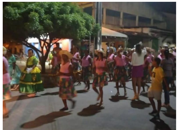
Grupo Gerando Amor, entrega de Enxovais.