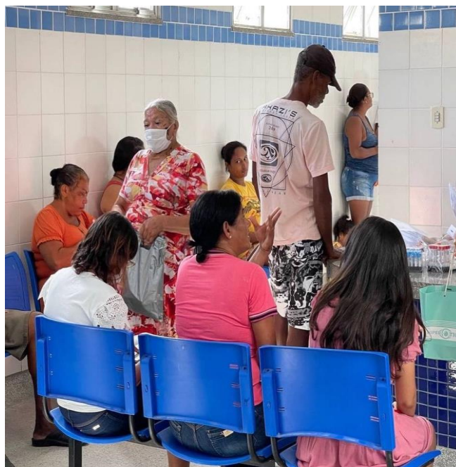
Coleta de exames laboratoriais