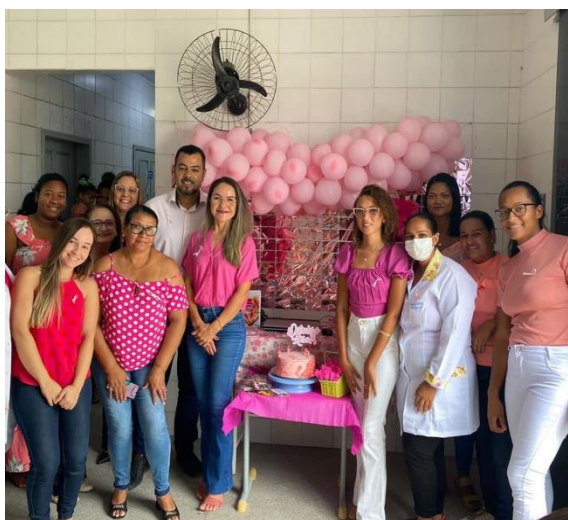
Atividades educativas nas UBS's