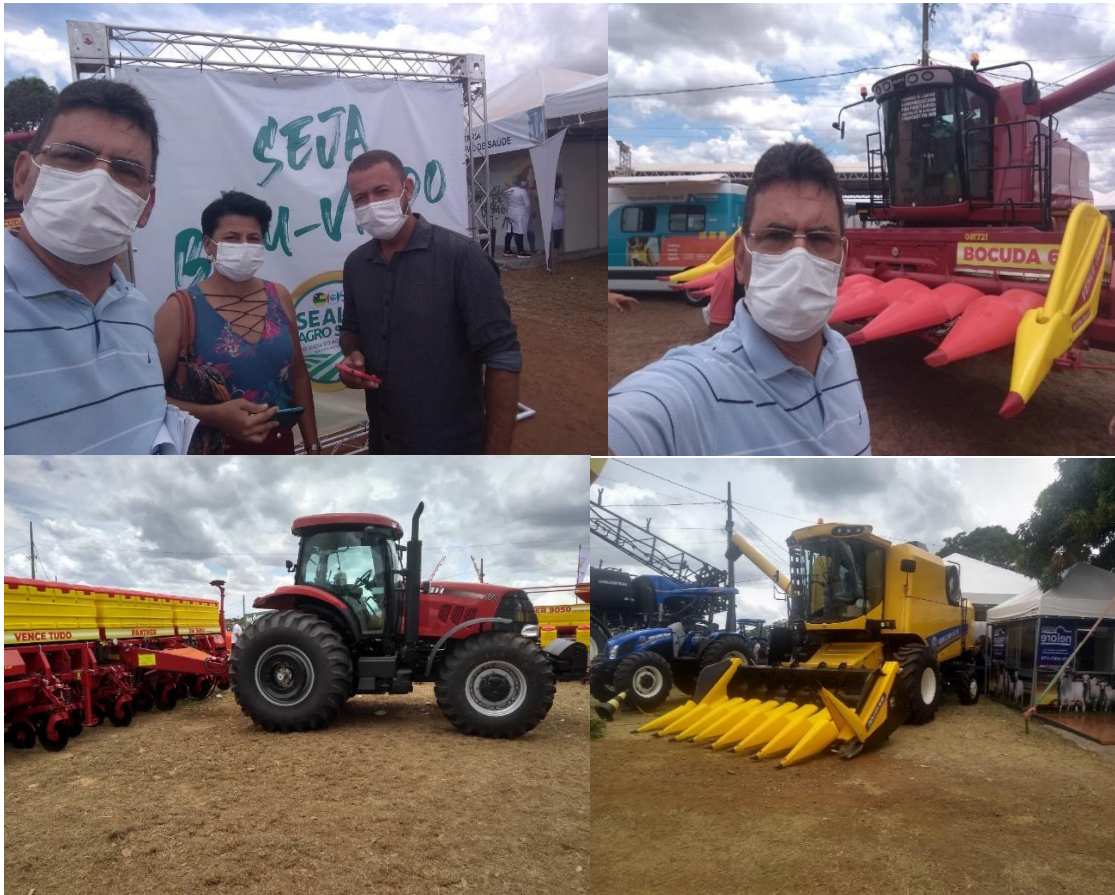
Data 10/02/2022 – Itabaiana/SE