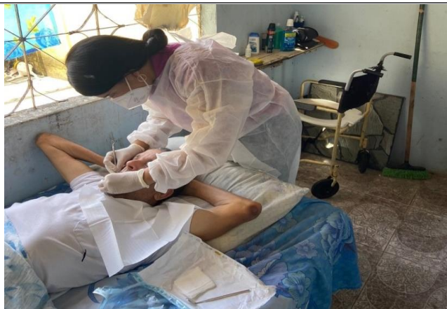
Atendimento domiciliar – Saúde Bucal