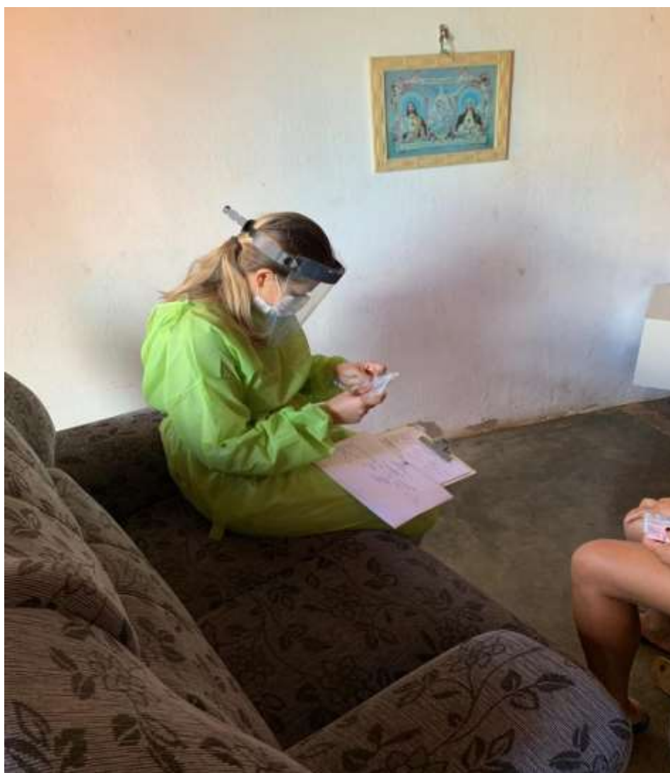
Visita de averiguação

A entrega dos cartões foi feita in loco e na sede da Secretaria de Desenvolvimento Social de Carira, após a devida averiguação do perfil dos possíveis beneficiários.