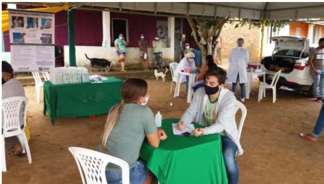
Atendimento no evento

de Agricultura em parceria com a Secretaria de Saúde e Secretaria de Desenvolvimento Social. Neste evento foram tiradas dúvidas a respeito do Bolsa Família e sobre o Auxílio Emergencial.