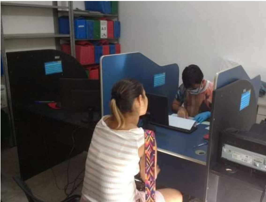
Entrega na sede