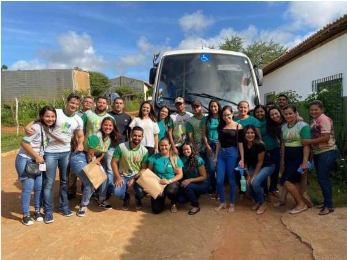
Saída para entrega in loco