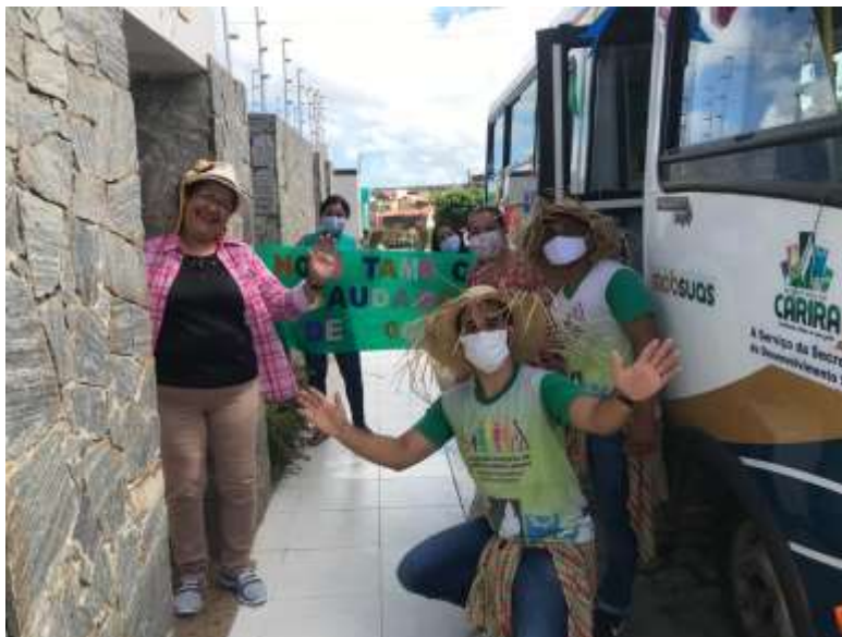
ENTREGAS DE KITS DE LANCHE E CARTILHAS