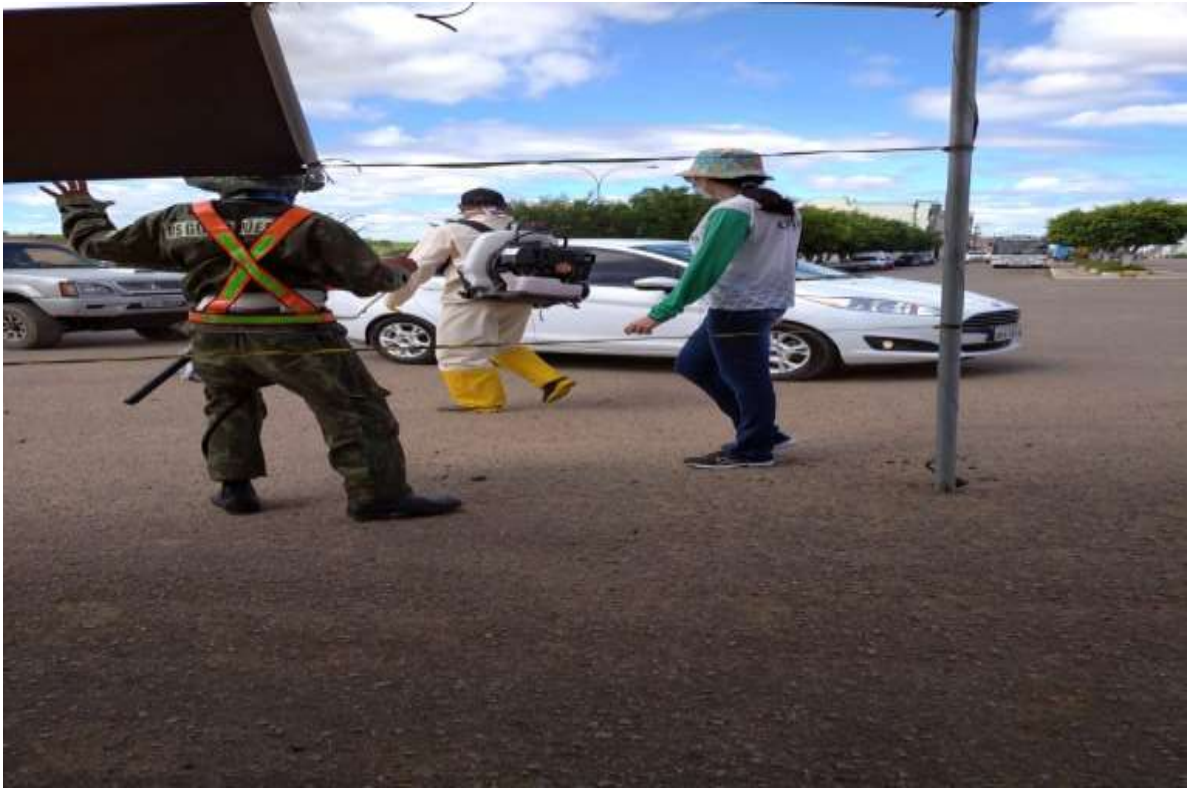
Barreira sanitária e orientação quanto a importância do uso da máscara em combate ao COVID19