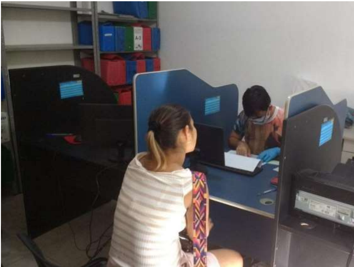
Entrega na sede