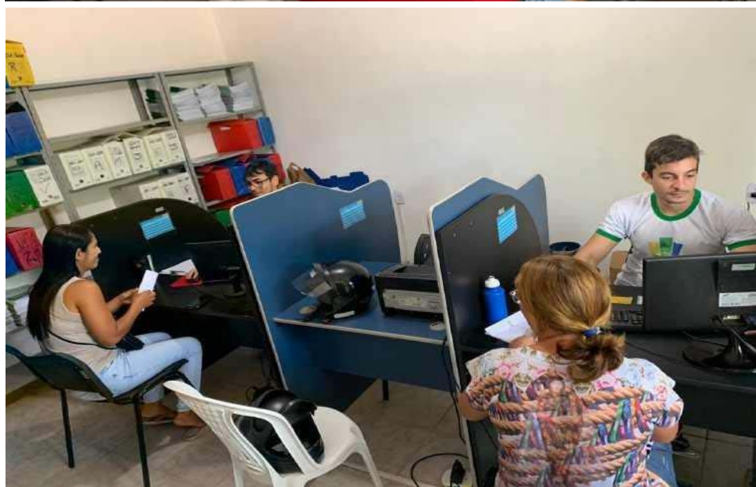
Atendimento aos usuários na Secretaria de Desenvolvimento Social.