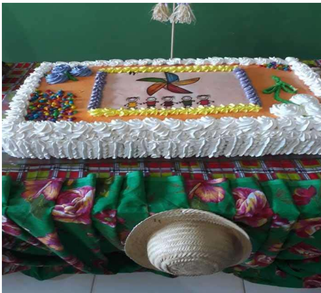
Palestra sobre o trabalho infantil na Escola Municipal Aroaldo Chagas.