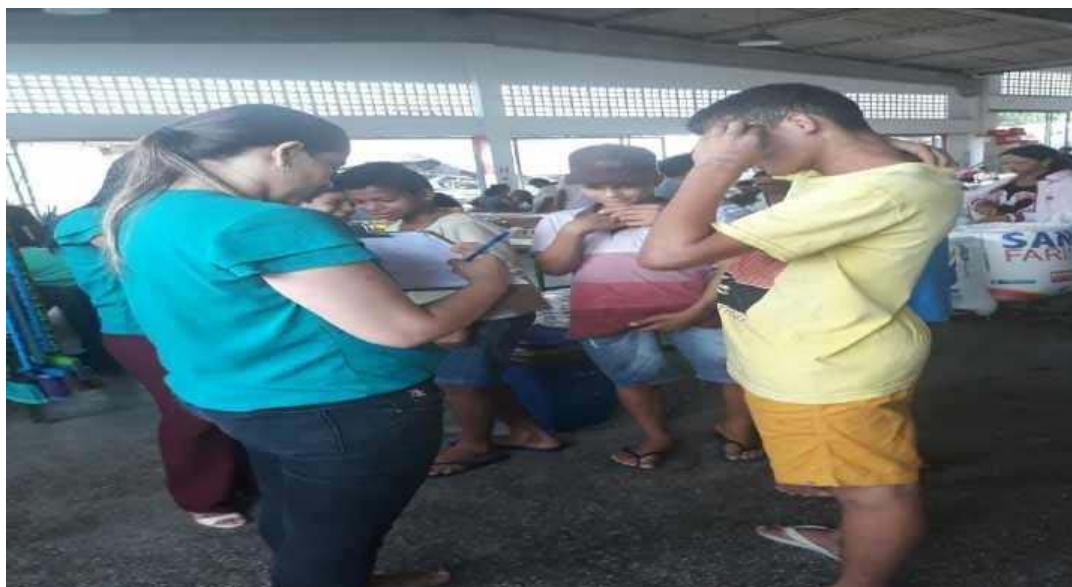
Foto da Busca ativa na feira livre desta cidade.

Palestra sobre o trabalho infantil no SCFV (Serviço de Convivência e Fortalecimento de Vínculos) com a presença do Conselho Tutelar.