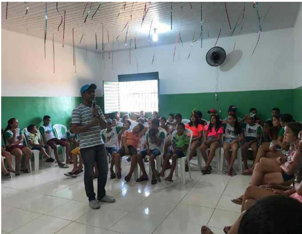
Reunião com os pais ou responsáveis das crianças ou adolescentes que faz carrego na feira livre desta cidade.