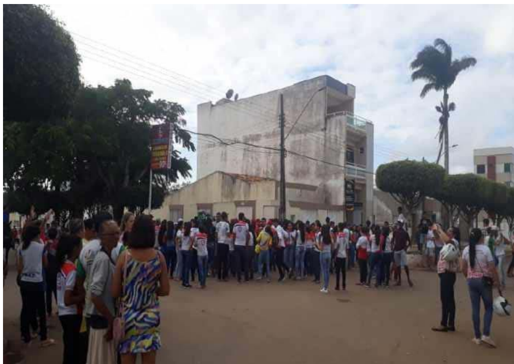
Caminhada Alusiva ao “Setembro Amarelo”.