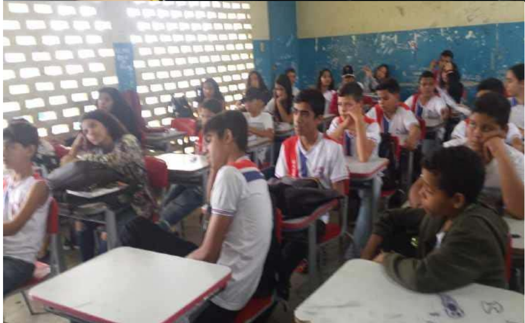
São João da Assistência.