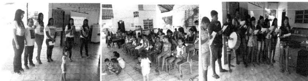
Dia das Avós