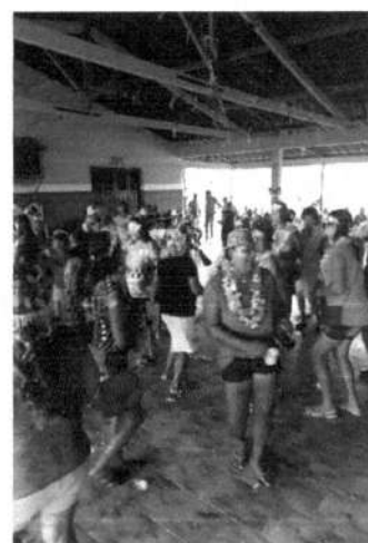
Dia Internacional da Mulher