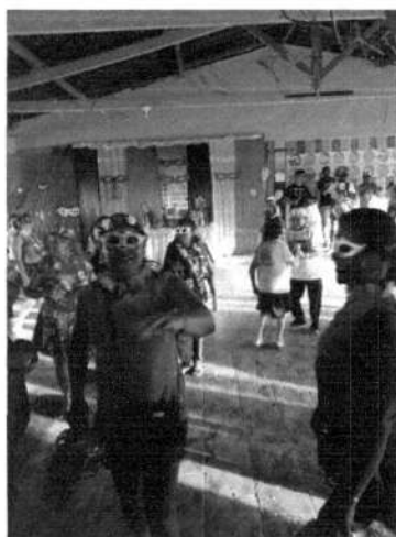
Comemoração do Carnaval