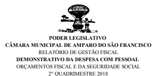
Tabela 1 - Demonstrativo da Despesa com Pessoal - Estados, DF, Municípios

RGF - ANEXO 1 (LRF, art. 55, inciso I, alínea "a")