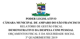
Tabela 1 - Demonstrativo da Despesa com Pessoal - Estados, DF, Municípios RGF - ANEXO I (LRF, art. 55, inciso I, alínea "a")