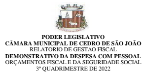
Tabela 1 - Demonstrativo da Despesa com Pessoal - Estados, DF e Municípios RCF - ANEXO 1 (LRF, art. 55, inciso I, alínea "a")