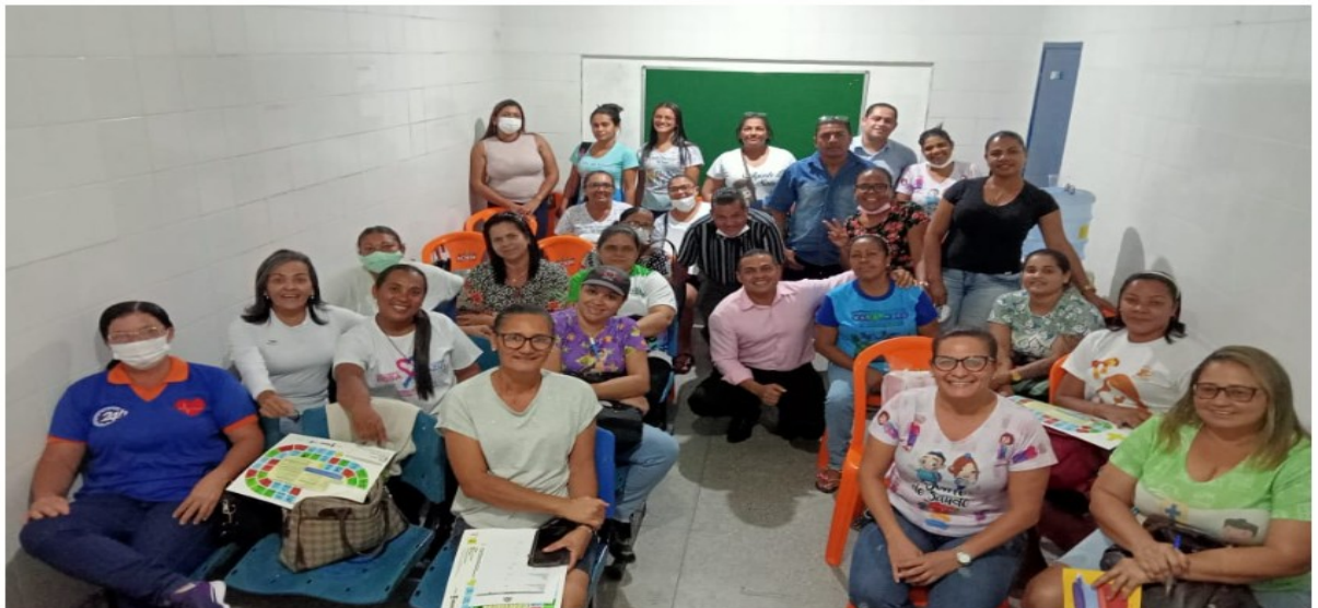
(REUNIÃO DE CAPACITAÇÃO DOS ACS)