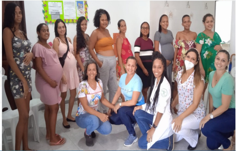
PROJETO MAMÃE CEGONHA