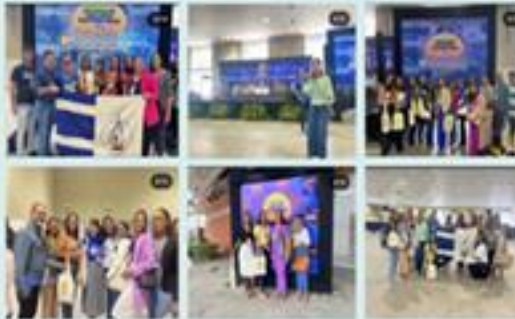
BOQUIM PRESENTE NA 8ª CONFERÊNCIA ESTADUAL DE SAÚDE