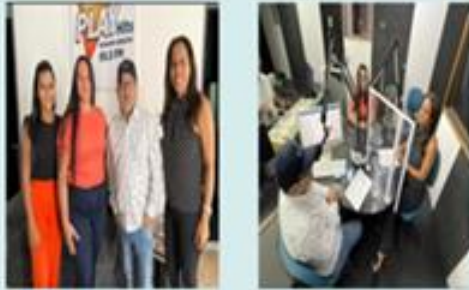
SECRETÁRIA DE SAÚDE BRUNA CRUZ CONCEDE ENTREVISTA NA RÁDIO PLAY HITS FM