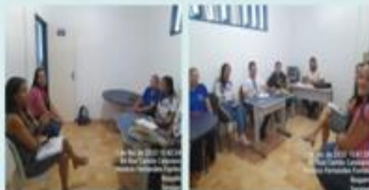
Secretaria de Saúde realiza reunião com o Conselho Municipal de Saúde