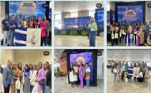
BOQUIM PRESENTE NA 8ª CONFERÊNCIA ESTADUAL DE SAÚDE