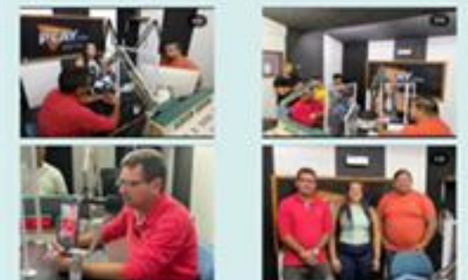
SECRETÁRIA DE SAÚDE BRUNA CRUZ CONCEDE ENTREVISTA NA RÁDIO PLAY HITS FM