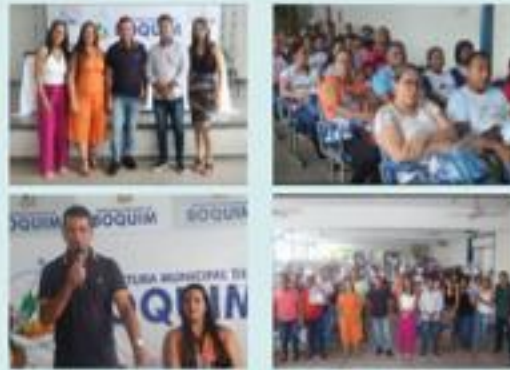
Secretaria de Saúde entrega kits com fardamentos para os ACS, ACE e Físicos da VISA