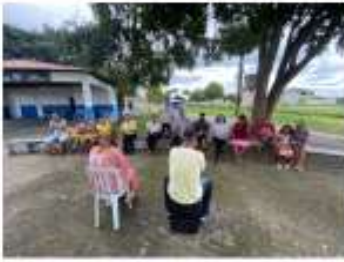
Atividades em conjunto com o CAPS Braz Fernandes Fontes