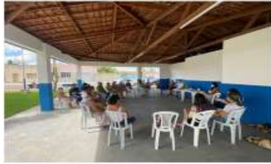
Rodas de conversa em alusão as campanhas mensais do Ministério da Saúde