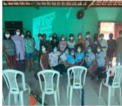
Hiperdia com as equipes da Saúde da Família