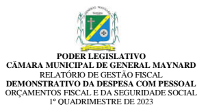
Tabela 1 - Demonstrativo da Despesa com Pessoal - Estados, DF e Municípios RGF - ANEXO I (LRF, art. 55, inciso I, alínea "a")