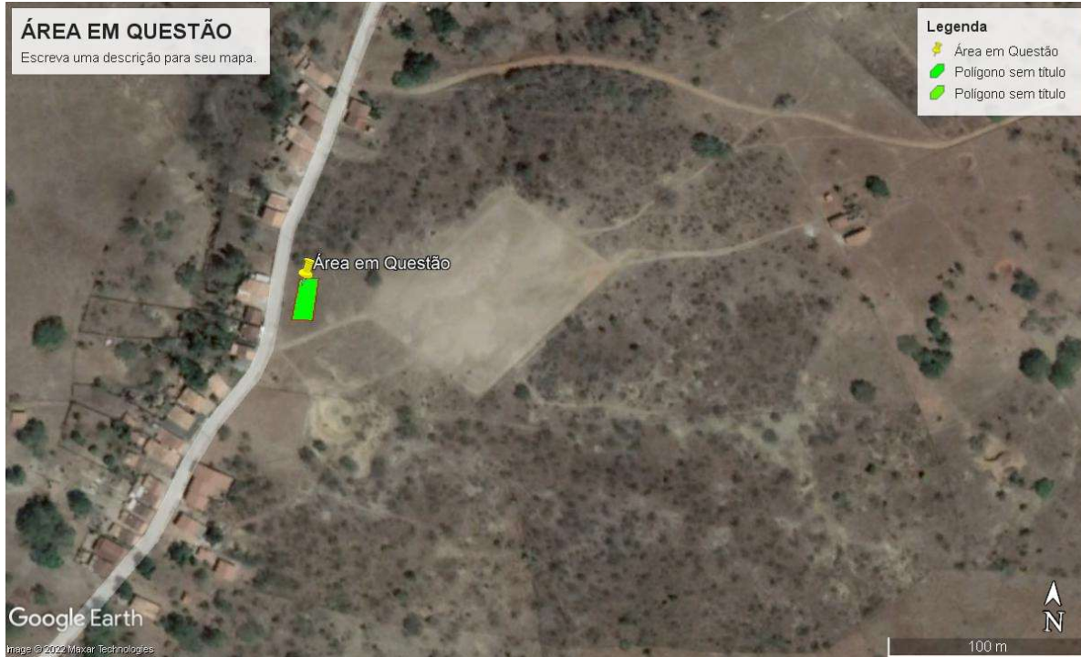
Figura 1 - PLANTA DE LOCALIZAÇÃO