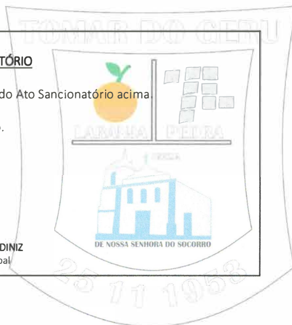
AUGUSTO SOARES DINIZ Prefeito Municipal