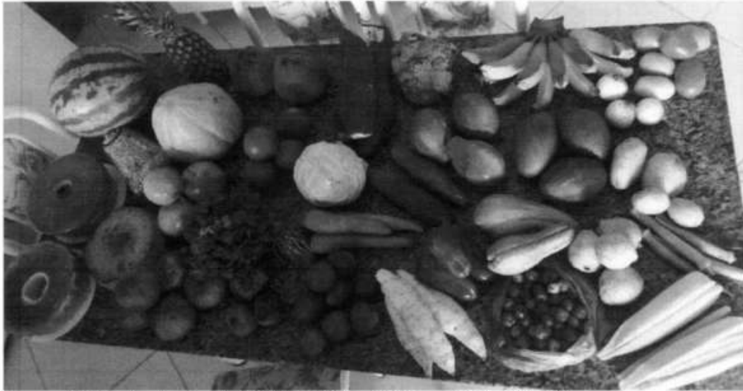
Imagem 05. Amostras dos itens da COOPERGERU na CPL, Tomar do Geru/SE, 2022.

No decorrer do ano os fornecedores solicitaram reequilíbrio de preços devido à instabilidade dos preços dos gêneros. Os processos foram recebidos e analisados pelo setor de licitação, juntamente com o Secretário de Administração, sendo concedido ou recusado de acordo com a veracidade e comprovação dos mesmos.