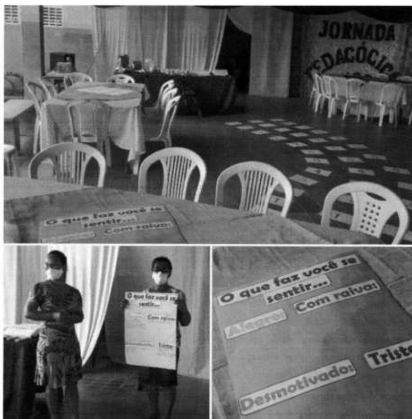
Imagem 07. Dinâmica sobre relações interpessoais no ambiente de trabalho, Tomar do Geru/SE, 2022.