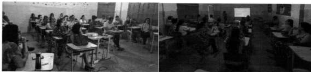
Imagem 09. Formação continuada em alimentação e nutrição para Professores da Educação Básica, Tomar do Geru/SE, 2022.

Durante o ano letivo foi desenvolvido com os professores a Formação Continuada em Alimentação e Nutrição, a qual ocorreu em quatro encontros ao longo do decorrer do ano letivo. Durante a formação, diversos temas foram abordados e foram sugeridas atividades para o desenvolvimento em sala de aula, bem como tipos de metodologias ativas (Imagem 09).