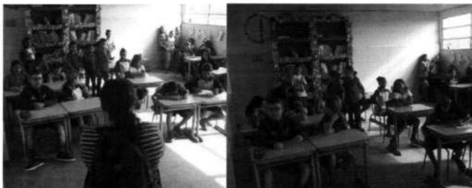
Imagem 11. Diálogo com os alunos sobre hábitos alimentares e saúde, Tomar do Geru/SE, 2022.

Tendo em vista que as principais alterações trazidas pela Resolução nº 6/2020 foram em nos cardápios para alunos menores de 03 anos, no início do ano letivo foi organizada uma reunião com os pais/responsáveis dos alunos da creche, onde foi apresentado o cardápio da alimentação escolar e discutida a importância de uma alimentação saudável nos primeiros anos de vida. Por fim, foi solicitado que lanches industrializados e doces não fossem ofertados aos alunos e nem enviados para as escolas (Imagem 12).