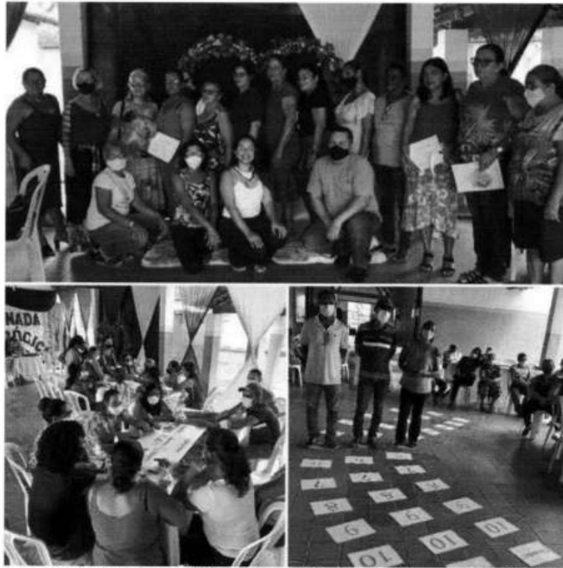
Imagem 06. Treinamento de Boas Práticas de Manipulação, Tomar do Geru/SE, 2022.

O treinamento ocorreu durante a jornada pedagógica, abordando de forma ativa os temas: Boas Práticas de Manipulação; Higiene e Comportamento Pessoal; Perigos e DTA's; Higiene de Ambientes e de Utensílios; Equipamentos de Proteção Individual – EPI; Recebimento de Gêneros; Fichas de Prateleira das Escolas; Apresentação dos Cardápios da Alimentação Escolar e de Eventos Escolares.