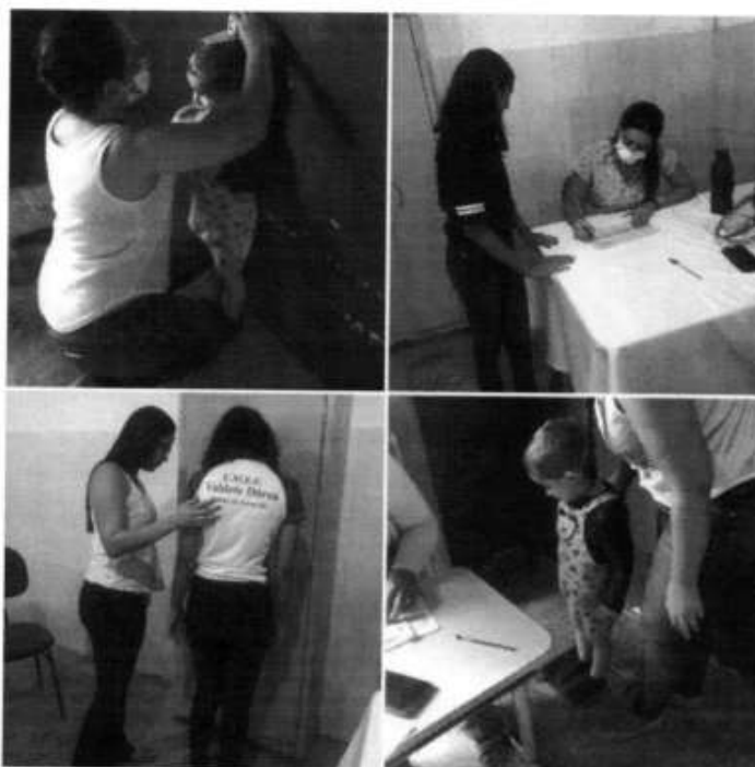
Imagem 13. Avaliação antropométrica dos alunos do sistema municipal de ensino, Tomar do Geru/SE, 2022

Após a coleta dos dados, cada aluno foi avaliado de forma individual e gerado o diagnóstico nutricional. Todos os alunos avaliados receberam um informativo com os dados e orientações sobre alimentação e aqueles que não estavam em situação de eutrofia receberam um encaminhamento para atendimento nutricional. Todos os dados também foram enviados para a equipe da secretaria de saúde (listagem do diagnóstico dos alunos e curvas de crescimento por turma/escola). Além disso, como meta para 2023, a coleta de dados ocorrerá inicialmente pelas escolas que não foram avaliadas em 2022.