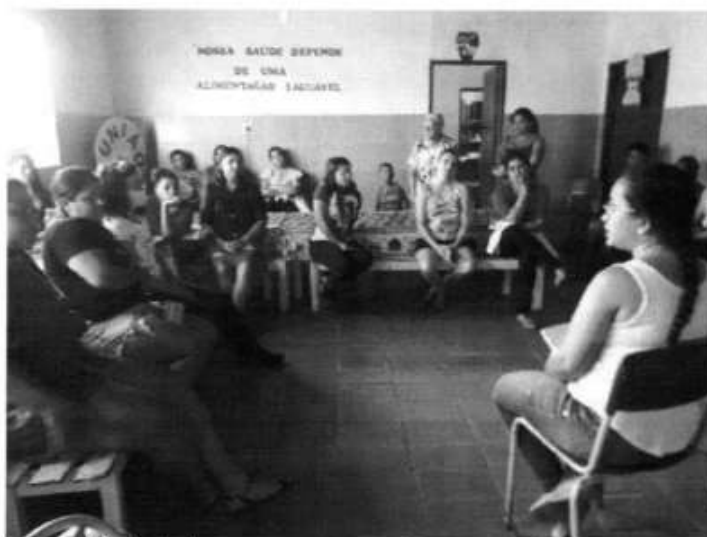
Imagem 11. Roda de conversa com os pais/responsáveis pelos alunos da creche, Tomar do Geru/SE, 2022

Tendo em vista que as principais alterações trazidas pela Resolução nº 6/2020 foram em nos cardápios para alunos menores de 03 anos, no início do ano letivo foi organizada uma reunião com os pais/responsáveis dos alunos da creche, onde foi apresentado o cardápio da alimentação escolar e discutida a importância de uma alimentação saudável nos primeiros anos de vida. Por fim, foi solicitado que lanches industrializados e doces não fossem ofertados aos alunos e nem enviados para as escolas (Imagem 12).