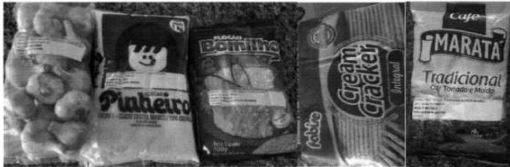
Imagem 4 – Amostras aprovadas da Empresa Projeet Soluções em Serviços e Alimentos Eireli, Tomar do Geru/SE, 2022.