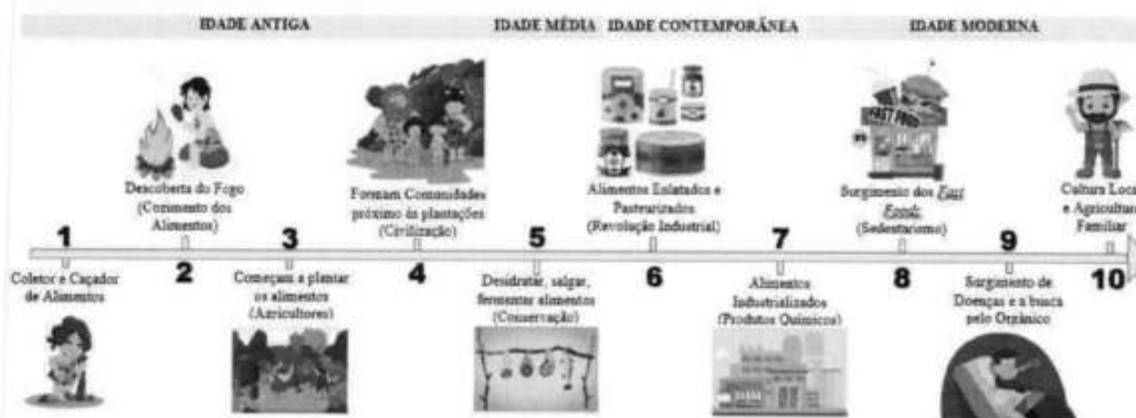
Imagem 10. Linha do tempo com a evolução da alimentação humana, Tomar do Geru/SE, 2022.

A proposta era abordar o tema “A origem da alimentação” de formar expositiva em praça pública para toda a comunidade, onde seria montado um túnel do tempo e cada equipe escolar montaria um cenário expondo como era a alimentação em cada período da história (Imagem 10). Além disso, as demais secretarias também montariam stands expositivos abordando diversos temas relacionados à alimentação. Contudo, o projeto foi cancelado pela Secretaria de Educação uma semana antes da sua execução devido à outras demandas emergenciais.