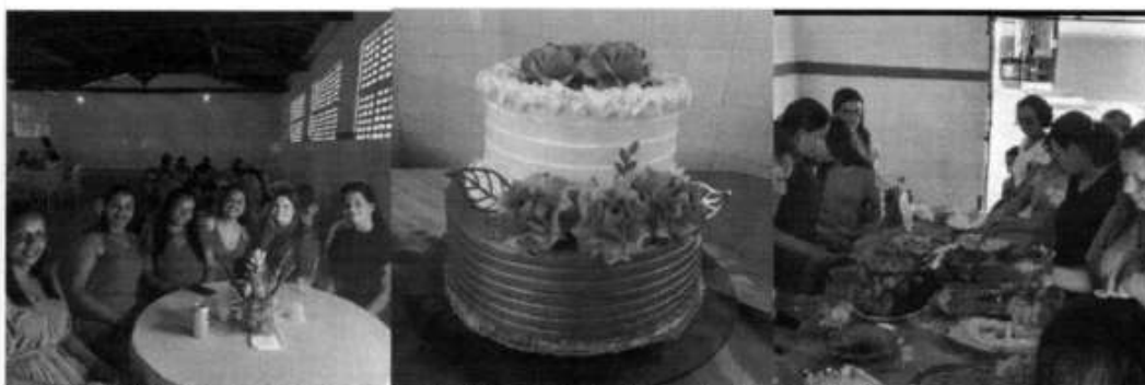
Imagem 14. Evento em comemoração ao dia da merendeira, Tomar do Geru/SE, 2022

Além disso, o DAE elaborou um evento em comemoração ao dia da merendeira (30/10), onde todos os funcionários de apoio das escolas foram convidados para um almoço de comemoração (Imagem 14).