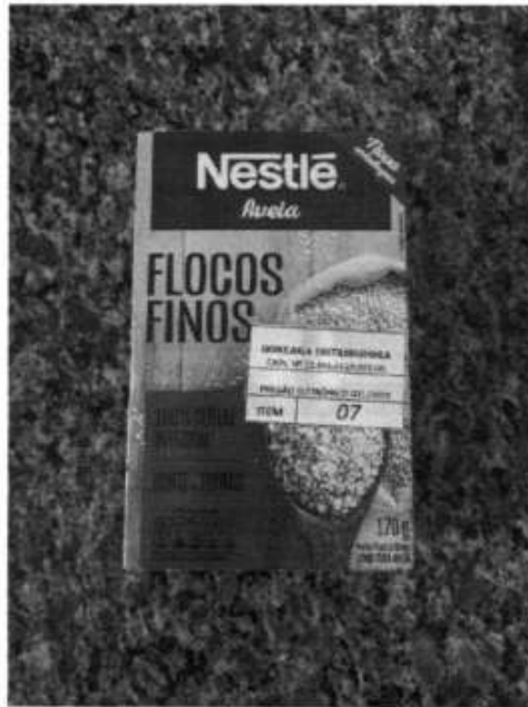
Imagem 1 – Amostra aprovada da Empresa Gonzaga Distribuidora de Alimentos Eirele, Tomar do Geru/SE, 2022.