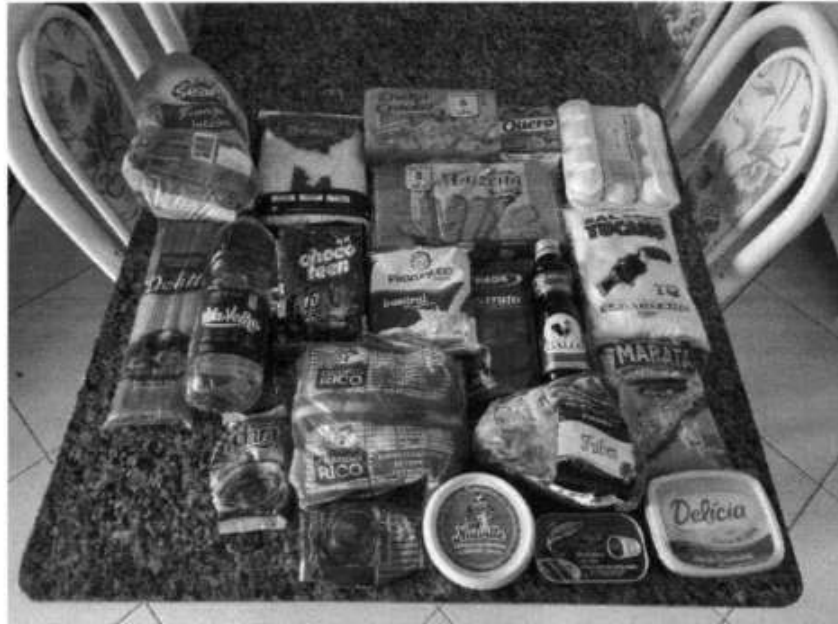
Imagem 3 – Amostras aprovadas da Empresa Vitalli Distribuidora de Alimentos Eireli, Tomar do Geru/SE, 2022.