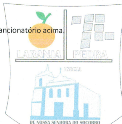
AUGUSTO SOARES DINIZ Prefeito Municipal