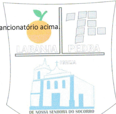
AUGUSTO SOARES DINIZ Prefeito Municipal