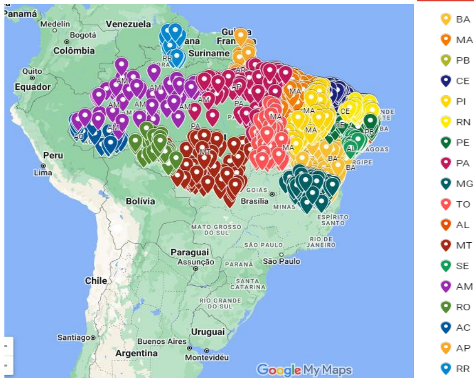
Mapa 2. Municípios que Aderiram ao Selo No Brasil.